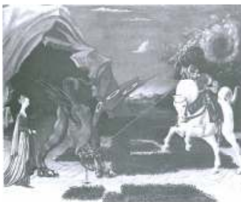
تصویر ۱. جرج لیس اوستا را می‌کشد که در سفر جوادیا نجات دهد. اثر مرید به فرد باوادم ایتالیاست.

اسفندیار پس از نابودی گرگ‌ها و موفقیت در شکست جنبه‌ای از جنبه‌های تاریک و درنده‌خوی وجود خود، در خوان دوم با دو شیر درنده مواجه می‌گردد. همان‌گونه که ارنست اپلی می‌گوید، این حیوان در رؤیای کسی ظاهر می‌شود که می‌خواهد به نقطهٔ اوج زندگی خود برسد. چنین کسی برای دریافت مرحلهٔ پختگی بایستی از شعله‌های آتش عبور کرده و با نیروی مهارنشدهٔ شیرمانند قهرمانان اساطیری مبارزه کند. او بر آن است که شیر سمبل خودآگاهی غریزی است و چنان تأثیری بر قهرمان سفرهای آیینی دارد که او را به سوی شخصیتی نو، با انتظامی نوین در غرایز هدایت می‌کند (اپلی، ۱۳۷۱: ۳۸۳).